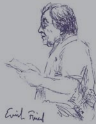
E. GITTERLE: ERICH FRIED

AN EINEM EINZIGEN ABEND BELEBEN WIR DAS KRAFTFELD IN BILD UND TON, IN TEXT UND WORT WIEDER – MIT REFERENTEN UND MITARBEITERN VON DAMALS.