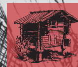
Bild: Wasserzuleitungen mit Sandfang oberhalb der Schwinghütte